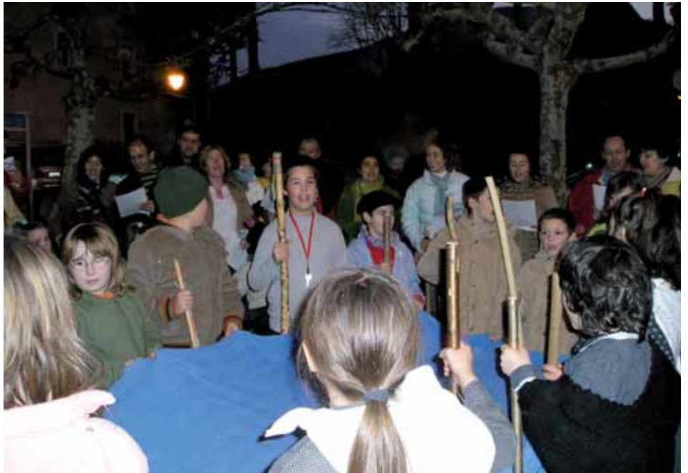
El AMPA se encargó de organizar la kalejira por el pueblo el día de Santa Agueda

Como repetiremos con mucho gusto la celebración de Santa Agueda. El 4 de febrero, el AMPA se encargó de organizar la kalejira por el pueblo, previamente en la escuela hubo un taller para padres y madres para preparar las canciones con la profesora de música. Lo cierto es que quedamos muy agradecidos por la enorme respuesta de la gente. Muchas