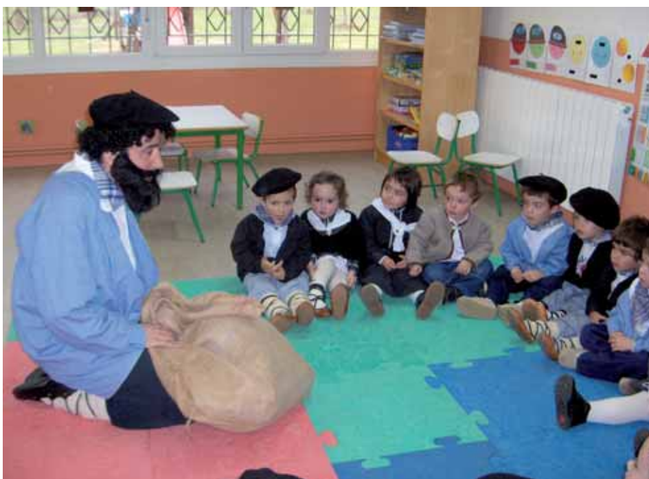
Olentzero visitó nuestro centro, aquí podemos verlo en el aula de 3 años

Gabonak hasi aurreko astean, urtero bezala, jarduera osagarri asko egon ziren. El día 15 de diciembre, el alumnado de 1º y 2º ciclo acudió al festival organizado por la Vital Kutxa. Este año no hubo concurso pero sí una actuación de payasos. El 18 acudieron Ed. Primaria al PIN y Ed. Infantil al Zizki-Mizki de Lau-dio. Como siempre, estas salidas se las tenemos que agradecer a la AMPA, que es la que subvenciona los autobuses. Las actividades organizadas en el PIN eran muy variadas, pero, como siempre, lo que más les llamó la atención fueron las barracas. En el Zizki-Mizki gozaron de los diferentes itinerarios psicomotrices