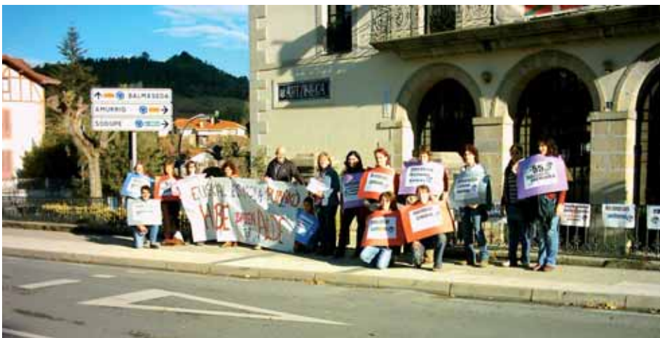
Encartelada de profesores el día de la huelga

Por ello, vemos que nuestra labor, además de nuestro trabajo y responsabilidad, es la reivindicación de toda mejora en la Enseñanza Pública.