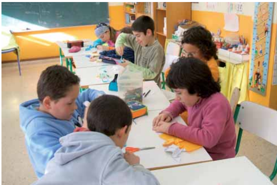
Cada alumno/a trabaja a su ritmo y nivel de conocimientos y de edad