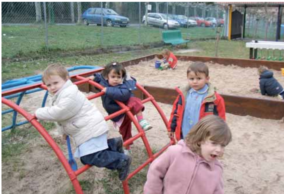
Niños de 2 años en el patio junto al arenero

última reunión para concretar todo. A partir de ese momento, como el proyecto de la obra ya lo tenemos hecho, lo que nos quedará por hacer es sacar a concurso los trabajos». El alcalde espera que «el nuevo edificio pueda estar terminado para el próximo curso escolar». La inversión que se realizará entre Gobierno vasco, Mendikoia y Ayuntamiento de Artziniega se eleva a 541.000 euros, es decir, 91 millones de las antiguas pesetas. Se espera que la obra esté finalizada para el otoño.