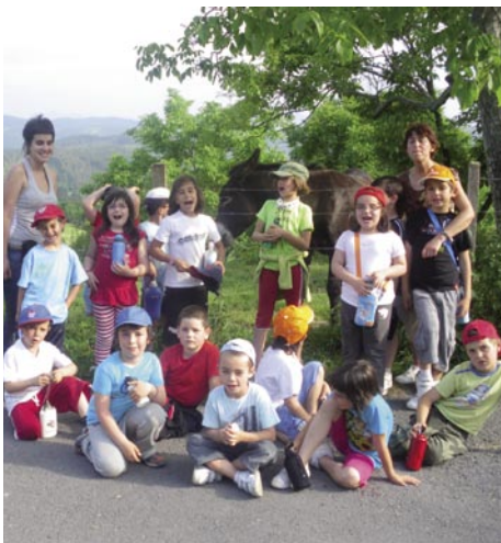
1. eta 2. maila Gorzikan