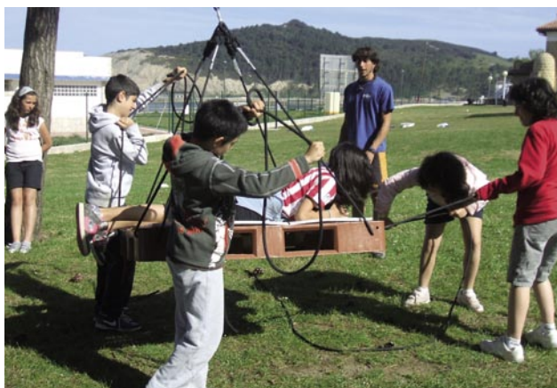
5º y 6º en Gorliz

Los estudiantes de 5º curso cuentan ya con los miniordenadores portátiles facilitados por el departamento de Educación. Entre la comunidad escolar surgió el debate sobre la inocuidad o no de la tecnología wifi sin cableado y por ello la AMPA decidió organizar sendas charlas para las familias, donde se expusieron argumentos en contra y a favor del wifi