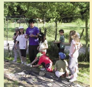
2. zikloa Sastarrainen