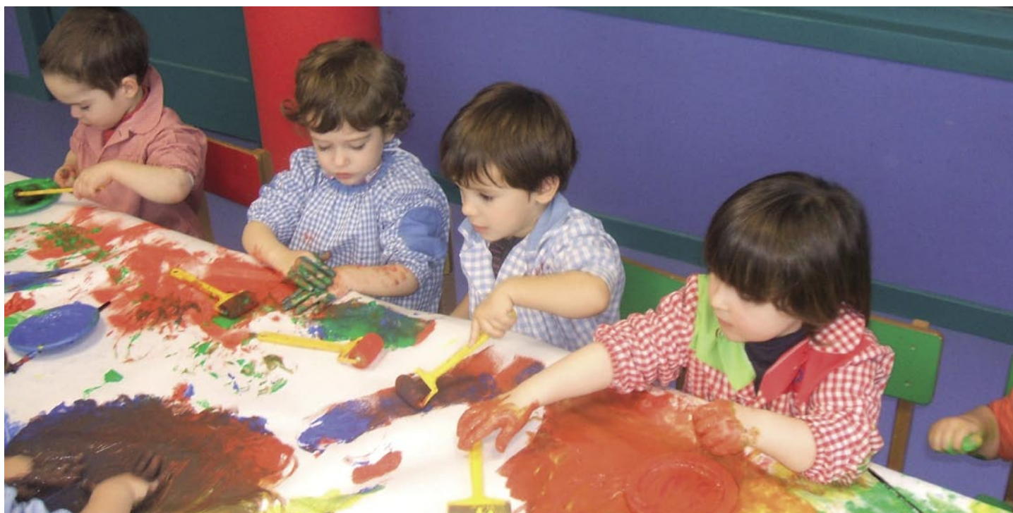
Alumnado de 2 años trabajando con colores

D urante este curso, y como excepción, se ha llevado a cabo un programa por parte de una ex-alumna de nuestro centro, y de manera voluntaria, consistente en acompañar una hora al día al alumnado que no goza de un entorno físico ni estímulos adecuados, poniendo los medios para hacer frente a su retraso escolar o prevenirlo.