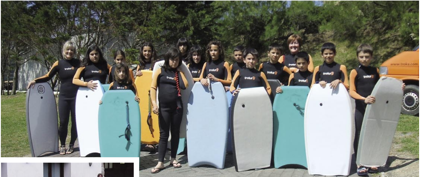
5. eta 6. maila Gorlizen