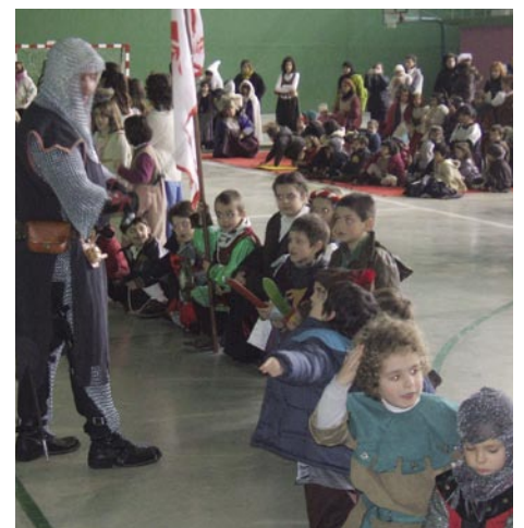
No faltó el nombramiento de Damas y Caballeros.