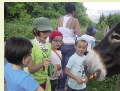
1. zikloa Gorozikan