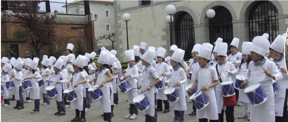
En San Prudenzio el alumnado puso la música y la AMPA la merienda