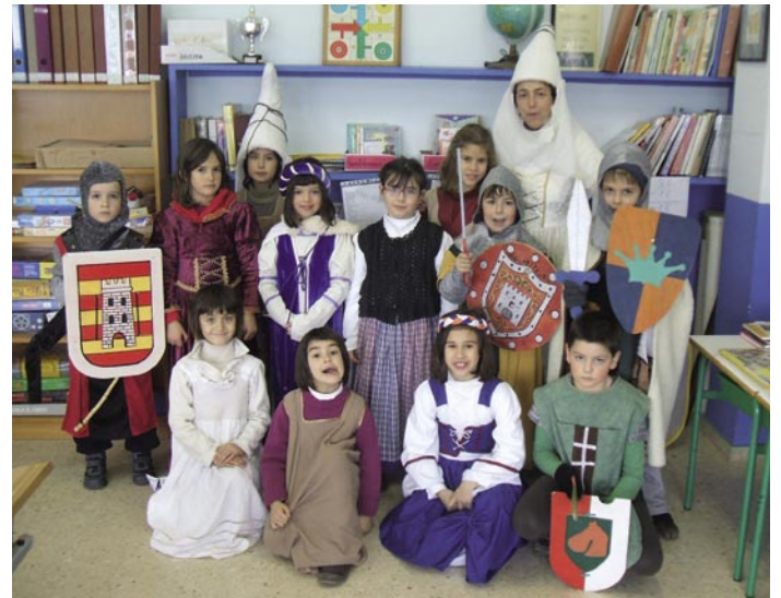
Ezkerretan 1. maila. Gainean 2. maila