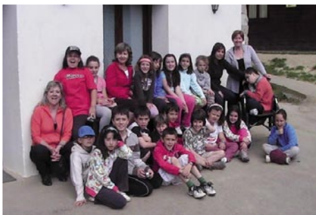
3. eta 4. maila Sastarrainen