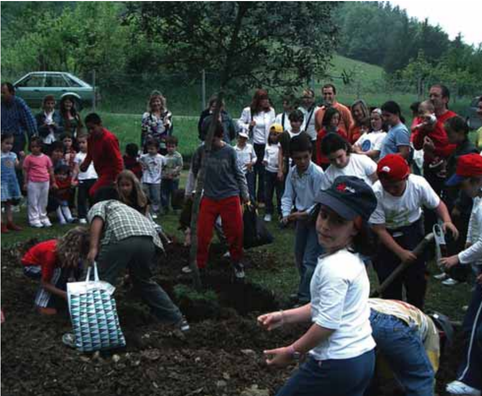
Plantación de nuestra encina, símbolo del centro.