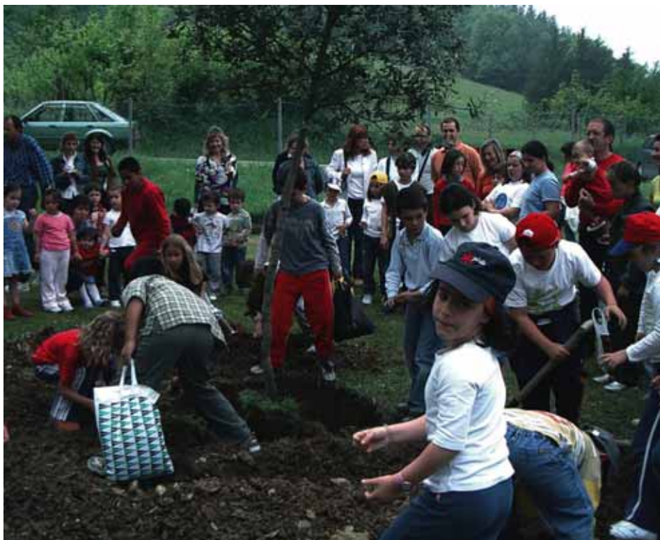
Plantación de nuestra encina, símbolo del centro.