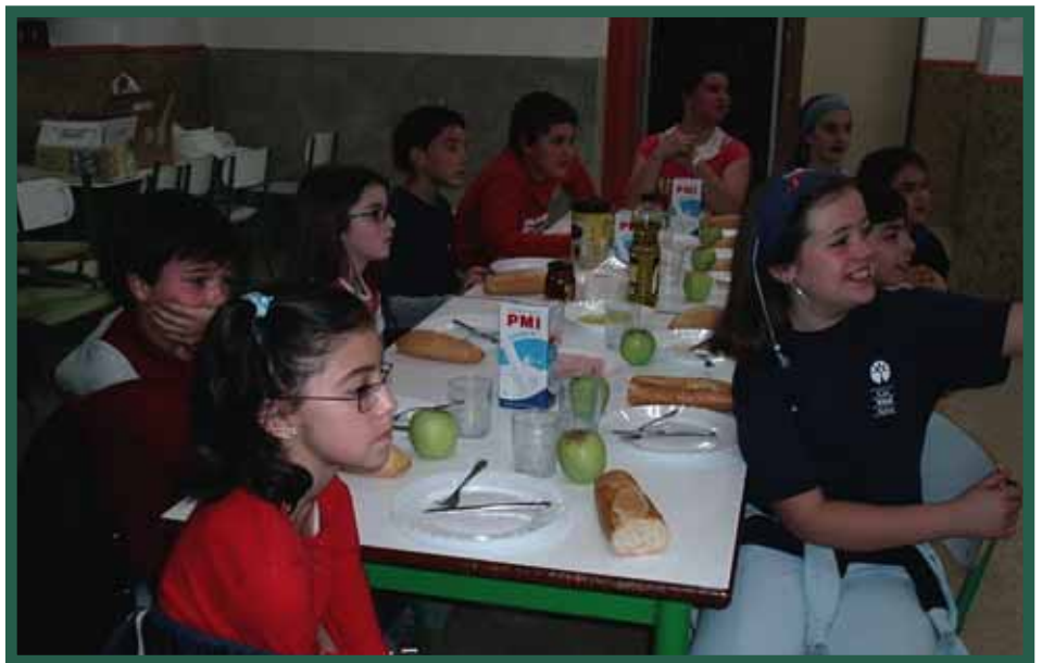
Alumnos del tercer ciclo durante las jornadas de "desayuno cardiosaludable".

«Hasieratik harreman estua izan nuen andereñoekin eta hau dela eta gorabeheraren bat suertatzen bazen konpon bidea ematen genion. Bigarren alaba ere herriko eskolan matrikulatu genuen oso positibotzat jotzen baikenuen aurreko urteetako esperientzia. Biak bi urtetik hamabi urtera egon ziren herriko eskolan eta Amurrioko Zaraobe Institutora jon zirenean ez zuten inolako arazorik izan bertako martxa hartzeko», azpimarratzen du.