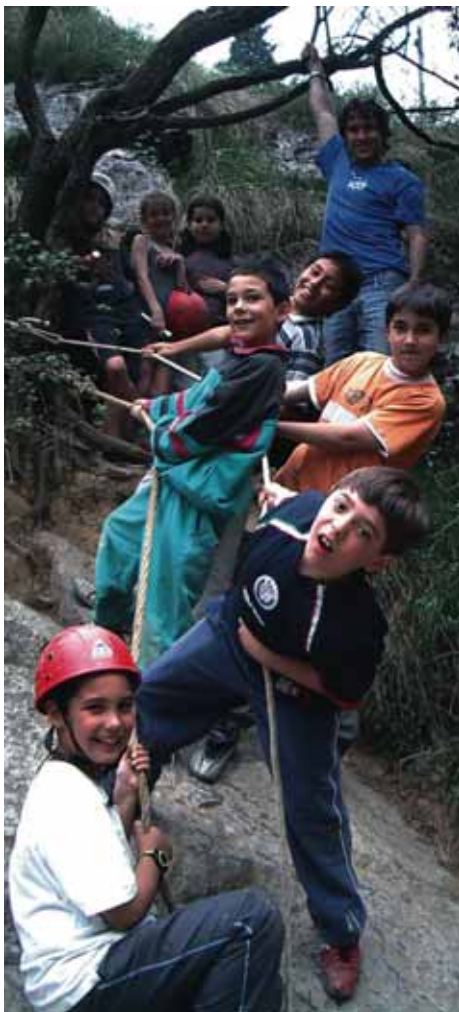
Segundo ciclo en Sastarrain.

«Kalitatezko heziketa integrala, publikoa, berriztatzailea eta plurala, euskara eta euskal kultura bultzatu eta garatzen duena, familiarra eta zuzena, gurasoen parte-hartzearekin eta eguneroko hobekuntzaren bidean pausoak emanez».