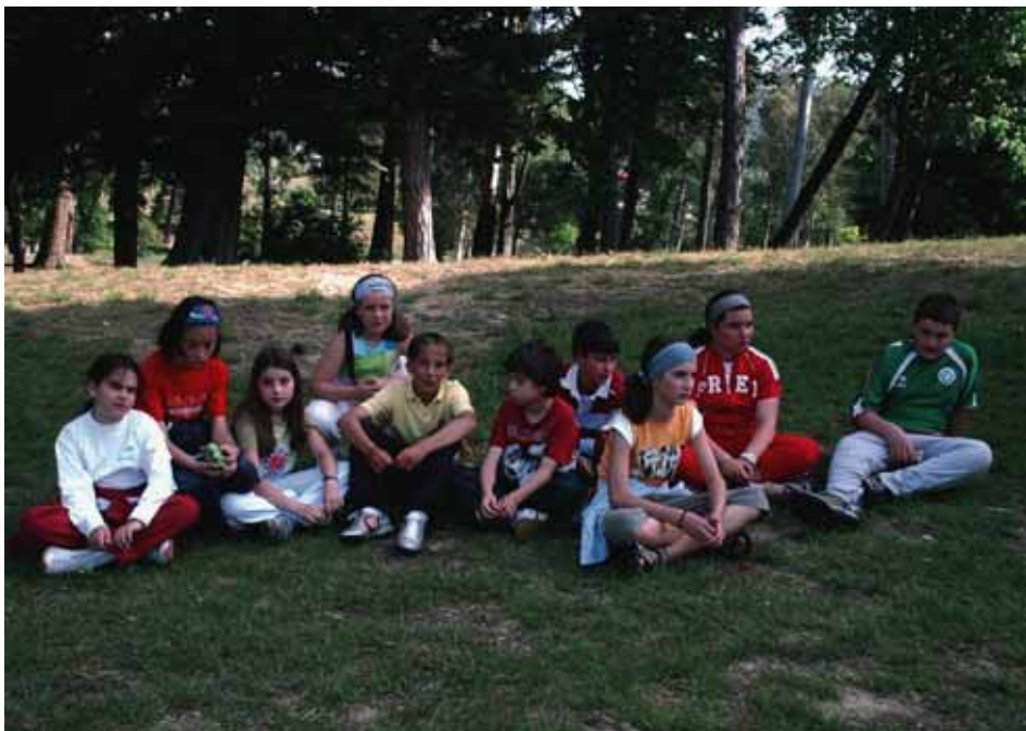
Grupo de niños en el barnetegi de Gorliz.

Nuestro alumnado sale bien preparado del colegio, preparado y atendido. No podemos obviar que se trata de clases reducidas donde la atención al chico o chica es máxima y prácticamente individualizada, algo imposible de lograr en un aula más masificada y a kilómetros de distancia de nuestro municipio. Además, el porcentaje de profesorado fijo en la escuela,