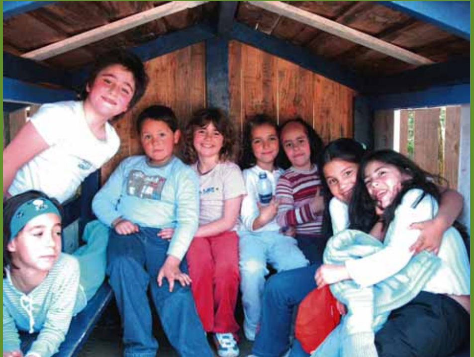
Salida al barnetegi de Baratze.