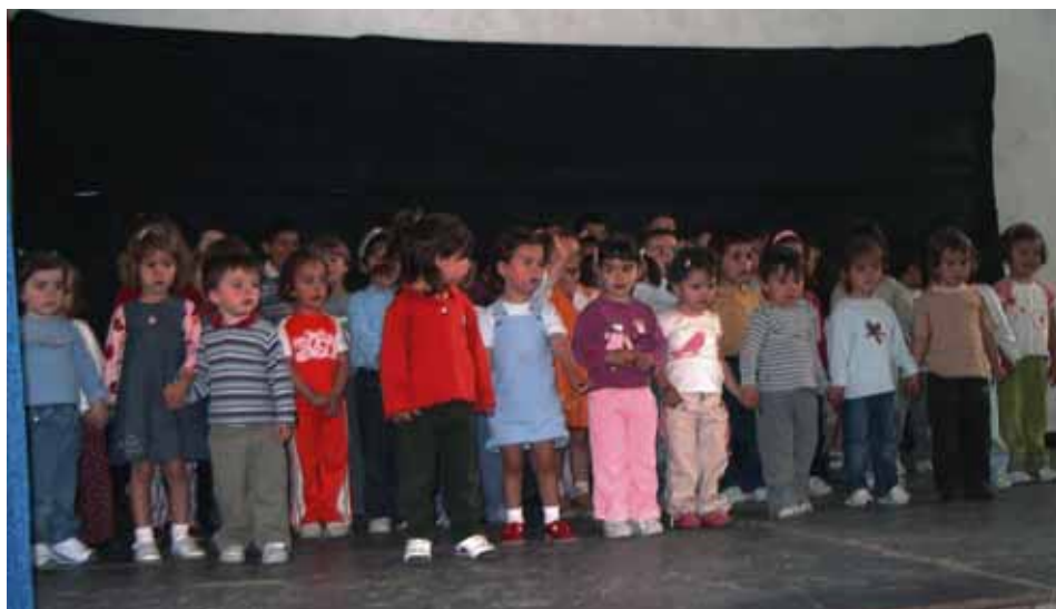
Algunos de los más pequeños.

Como podéis apreciar, año a año el colegio Arteko Gure Ama se supera en actividades, con la implicación de los protagonistas, los chavales, pero también cada vez más del profesorado y de los padres y madres.